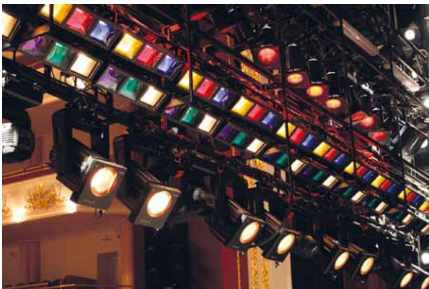
Один из семи софитов Самарской оперы

Обязательным атрибутом любой сцены, где ставятся балетные спектакли, являются перекатные осветительные башни. Их назначение – нести на себе приборы, необходимые для освещения ног танцующих. В то же время эти механизмы часто представляют собой определенную угрозу для безопасности актеров – выбегая из-за кулис, балерины рискуют удариться о металлические платформы этих башен. В Самарском театре перекатные башни снабжены