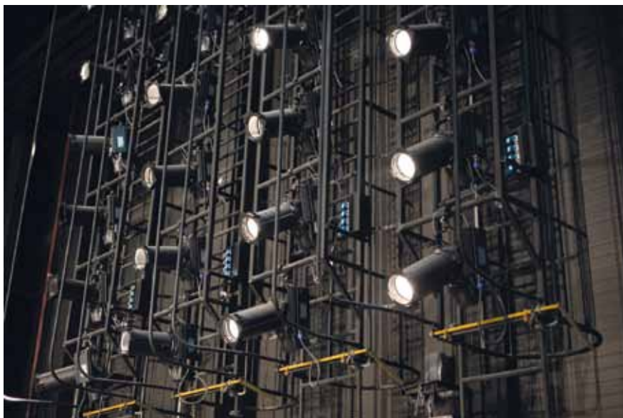
Подвесные осветительные башни

И наконец неотъемлемая часть оснащения современной оперной сцены – качественное звуковое оборудование. Не секрет, что использование электроакустических систем значительно расширяет возможности архитектурной акустики. Тем более, что в проекте изначально предусматривалась многофункциональность Самарского театра. В итоге специалистам «Системы» пришлось искать такую конфигурацию звуковой системы, которая бы могла обеспечить и чистое воспроизведение музыки, и разборчивую передачу речи, и хорошее рассеивание звука в зрительном зале.